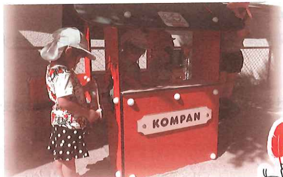
↑ 保育園の遊具購入への支援