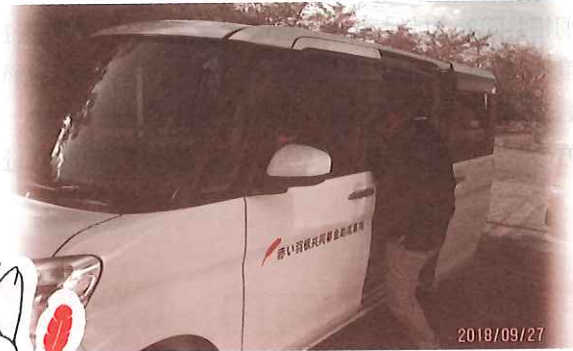
↑ 就労支援施設の送迎用車両購入への支援