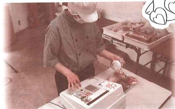
↑ 就労支援施設の器具等購入への支援