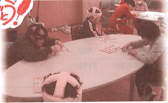
↑ 障がい者支援施設の作業機購入への支援